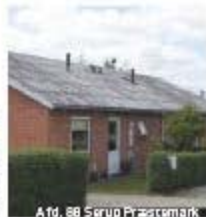
Afd. 88 Serup Præstemark