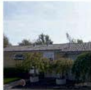
Afd. 18, Møddabrovej