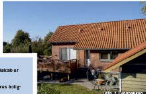
Afd. 7, Lynebakken