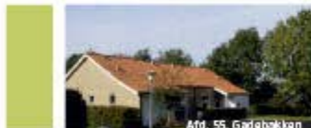
Afd. 55, Gadebakken