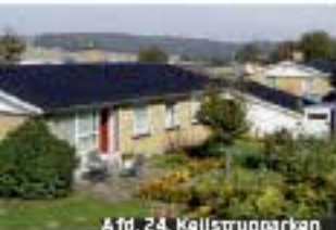
Afd. 24, Kallistrøgetvej

Gå ind på www.boligkontoret.dk – og bliv skrevet op til en bolig allerede i dag.