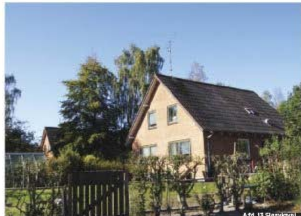
Afd. 15 Nylandsvej