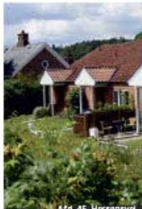
Afd. 48, Hørslevvej

Vi glæder os til at hjælpe med at finde dit næste hjem.