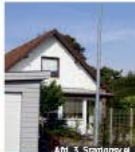
Afd. 3, Skovvej