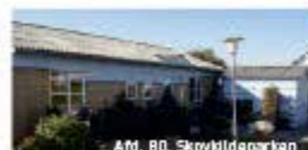
Afd. 80, Skovildparken

Vores boliger er beliggende på attraktive adresser – ikke blot i forhold til midtbyen og de naturskønne omgivelser tæt ved vand og skov, men også i forhold til motorveje og togstation, der giver nem adgang til både Århus, hele trekantområdet og København.