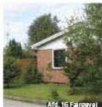
Afd. 16 Færgvej