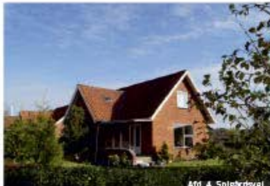
Afd. 4, Solbrøndevej

De fleste af vores lejeboliger er centralt beliggende i Skanderborg. Derudover råder boligselskabet over boliger i naturskønne omgivelser i Virring, Herring, Stilling, Solbjerg, G. Rye, Stjær, Låby, Gjesing, Hårby Nr. Vissing og Aarhus.