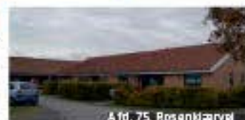
Afd. 75, Rosenkærvej