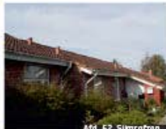
Afd. 62, Silmøroten