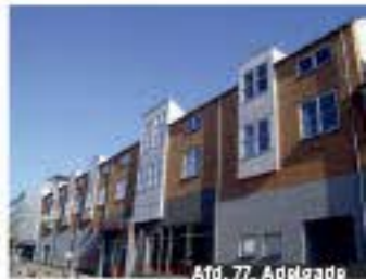
Afd. 77, Adriansvej