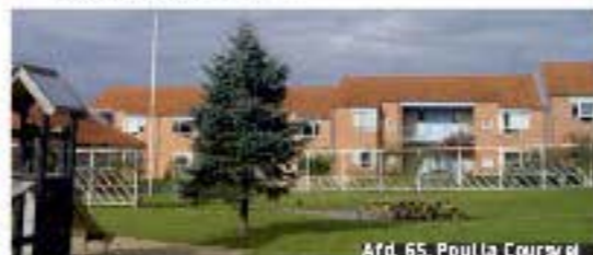
Afd. 65, Poula Courvej