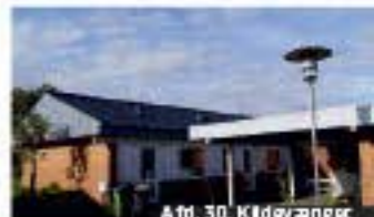
Afd. 30, Kløvedalvej